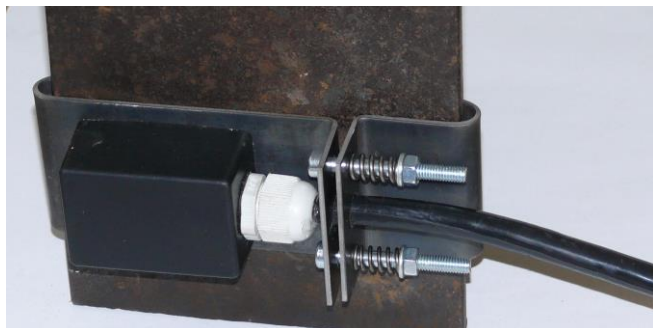
Рис.1. Внешний вид датчика